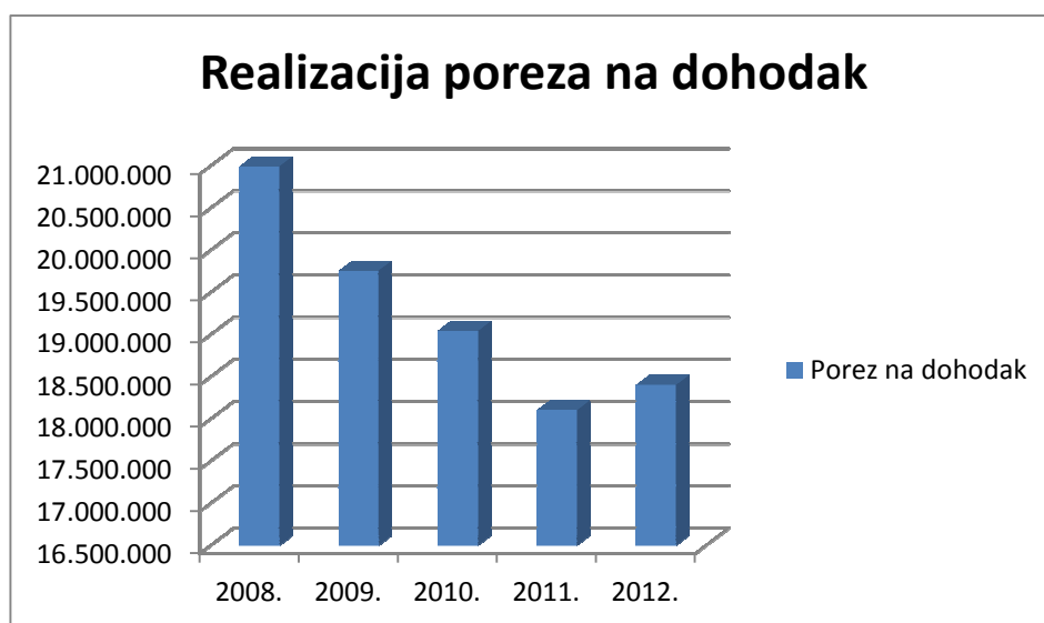
Grafikon broj 1: Pregled prihoda od poreza na dohodak od 2008. do 2012. godine

Prema ostalim financijskim izvještajima pokazatelji su slijedeći: